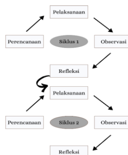
Gambar 1. Model John Elliot

Tahap observasi dilakukan pada proses pembelajaran yaitu mengamati aktivitas siswa dan guru, juga termasuk keaktifan serta sikap siswa dan guru selama proses pembelajaran lalu pada akhir siklus dilaksanakan tes untuk mengetahui hasil belajar siswa. Tahap selanjutnya adalah refleksi yang digunakan untuk mengetahui kelemahan dan kelebihan ketika pembelajaran berlangsung. Apabila belum diperoleh hasil sesuai indikator keberhasilan, maka dilanjutkan siklus 2 sampai indikator keberhasilan terpenuhi. Berikut hubungan keempat tahapan dalam suatu siklus (Gambar 1).