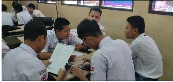
Gambar 3. Pembelajaran Problem based learning siklus 2

Tahap observasi pada siklus 2 dilakukan oleh teman sejawat menggunakan lembar observasi pada saat pembelajaran. Berdasarkan hasil observasi didapatkan bahwa peneliti telah melaksanakan pembelajaran secara runtut serta siswa terlibat dalam penerapan model pembelajaran problem based learning berbasis pendekatan TaRL.