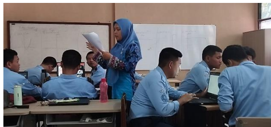
Gambar 2. Pembelajaran Problem based learning siklus 1

Pada pelaksanaan siklus 1 dilaksanakan dua kali pertemuan dengan alokasi pembelajaran 8 jam ( 8 \times 45 menit). Pertemuan pertama dilaksanakan pada hari Kamis, 28 Maret 2024 jam ke-4 sampai ke-7 sedangkan pertemuan kedua dilaksanakan pada hari Rabu, 24 April 2024 jam ke-1 sampai ke-4. dokumentasi pelaksanaan siklus satu dapat dilihat pada gambar 2 berikut.